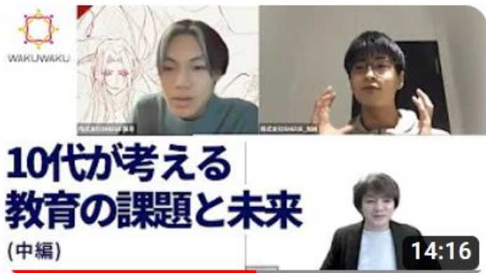
10代が考える教育の課題と未来 (中編)