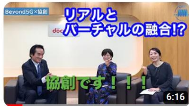
【Beyond 5G×協創】リアルとバーチャルの融合