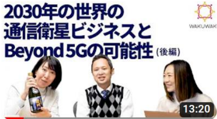
【Beyond 5G×宇宙】2030年の世界の通信衛星ビジネスとBeyond 5G...