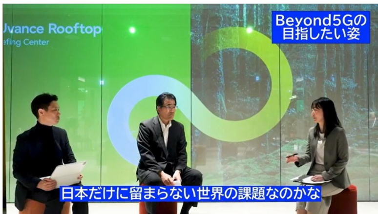
もはやライバルではない？富士通とNECが目指すBeyond 5Gの世界