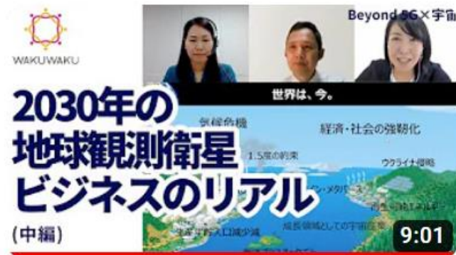
【Beyond 5G×宇宙】2030年の地球観測衛星ビジネスのリアル (中編)