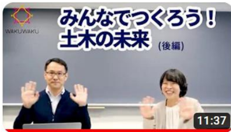
【WAKU WAKU 2030】みんなでつくろう！土木の未来 (後編)